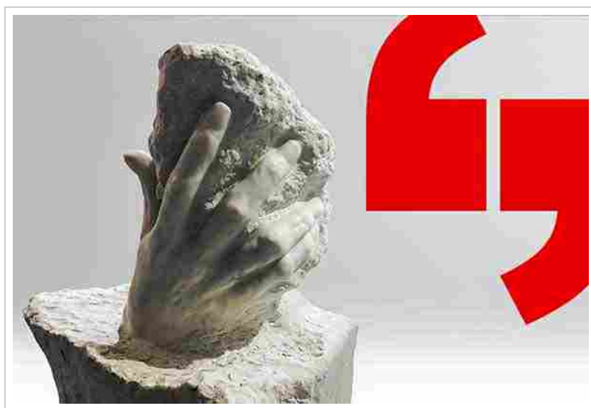
August Rodin, La Creazione